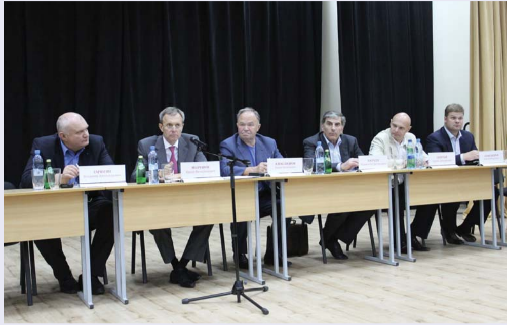
Общее годовое собрание акционеров ОАО «Метрострой» прошло 24 июня 2011 года. На нем были заслушаны отчеты об итогах работы в 2010 году, годовой бухгалтерской отчетности и работе ревизионной комиссии. По результатам голосования были утверждены годовые отчеты, избраны совет директоров и ревизионная комиссия. Также был утвержден аудитор (ООО «Аудиторская фирма «ПолитехАудит») и одобрен ряд сделок. Прибыль за 2010 год распределена следующим образом: на развитие материально-технической базы ОАО «Метрострой» – 522,991 млн рублей, на выплату дивидендов за 2010 год – 11,29 млн рублей. Принято решение выплатить дивиденды из расчета 36 рублей на обыкновенную акцию и 45 рублей на привилегированную акцию типа «А» номиналом 0,5 рубля (за 2009 году дивиденды составляли 33 рубля и 41 рубль соответственно). Чистая прибыль ОАО «Метрострой» в 2010 году выросла на 9,6 % по сравнению с предыдущим годом.

В августе в Выборгском районе Ленинградской области ООО «Тоннельный отряд-4» завершило проходку микротоннеля, входящего в состав газопровода Грязовец – Выборг: 250-метровый тоннель под Сайменским каналом является завершающим этапом этого строительства.